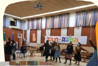
מסיבות חנוכה תודה לאדריכות