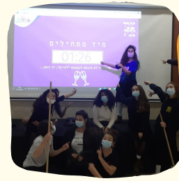
צמאה היה אשש!