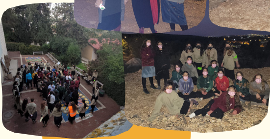
ההשבעהההה מי שלא הייתה- ברווז