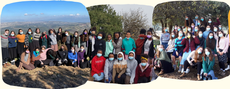
סירי שלה תהנו מתוקות

למיל תמונות עם הסבר קצרה (יזא): רצות להופיע פה גם? שלחו לנו