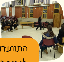
התוועדות לכבוד י"ט כסלו